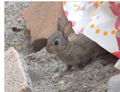
Un des jeunes.