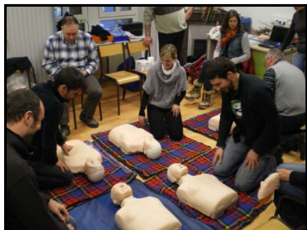
Entraînement au massage cardiaque sur mannequins.