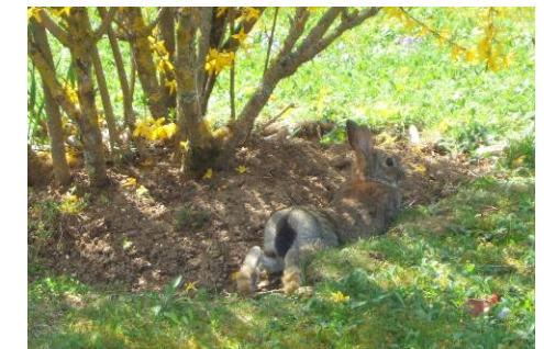
Petite sieste à l'ombre d'un forsythia...