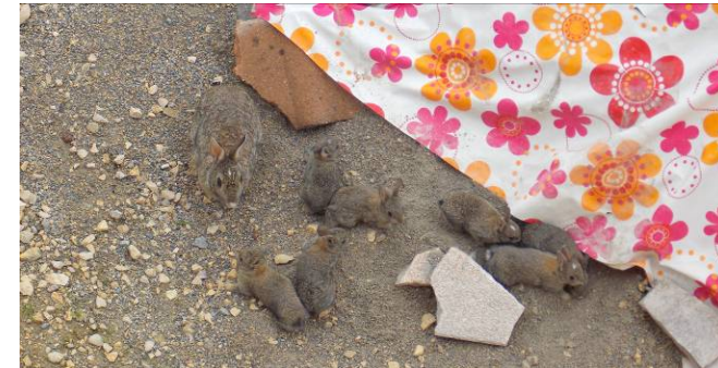
La mère et ses 7 petits près de leur terrier.