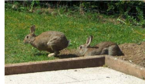
Terrier à l'angle de la terrasse.