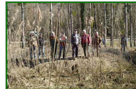
Une partie de l'équipe