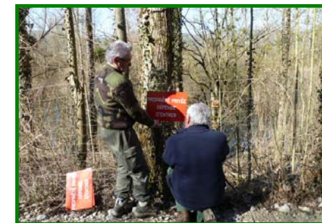
Pose de panneaux

Un grand merci aux bénévoles qui se sont déplacés.